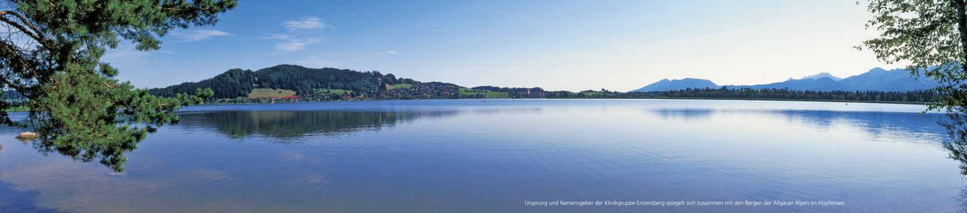
Ursprung und Namensgeber der Klinikgruppe Enzensberg spiegelt sich zusammen mit den Bergen der Allgäuer Alpen im Hopfensee.